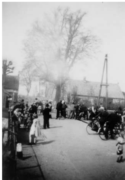
10 mei 1942: Er is een vuurtje gestookt in de oude lindeboom.